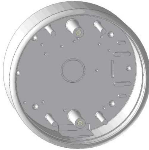
押しボタン用取り付けボックス (114mm 丸型面付け)

当社の押しボタンスイッチの商品は面付け型、埋め込み型押しボタンスイッチ LCN's line of pushplate hardware is expanded by its line of surface and flush mount pushplate boxes. These boxes are made of durable ABS plastic and are made to securely mount a pushplate and a LED pushplate and are designed for the waterproofing and reinforcement of the pushplate. They are also designed to attractively recess the pushplate in the housing to and to minimize vandalism from prying up the pushplate.